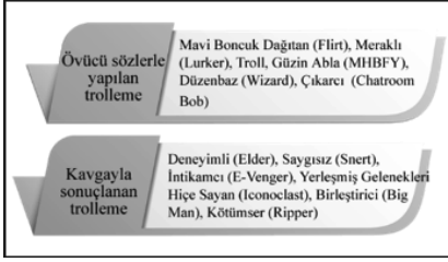
Şekil 2. Gönderilen Mesajlara Göre Trolleme Türleri

Bishop (2012b) gönderilen mesajlara göre trollemeleri; “övücü sözler içeren trolleme” (kudos trolling) ve “kavgaıyla sonuçlanan trolleme” (flame trolling) şeklinde iki grupta toplamaktadır. Tablo 1’de tanımlanan trollerin kullandıkları trolleme yöntemleri de Şekil 2’deki gibi sınıflandırılmaktadır (Trolling Academy, 2012).