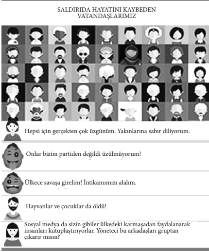
Şekil 8. Politik Trollere Örnek

Politik Trolller: Bu troller ideolojik açıdan karşıtlarını baltalamanın yollarını ararlar. Bu troller özellikle karşıt görüşleri savunarak muhaliflerle alay edip partizanları aşırı uç diyaloglara maruz bırakmak için ölçsüz ve çirkin yorumlar yazar ve muhalifleri baltalarlar (Benson, 2013). Politik troller, uç pozisyonlardakilere sözde saygı ve samimiyet göstermek için hiciv ve güldürüden yararlanma eğilimindedirler. Bu amaçla övücü ve mahcup edici teknikler kullanılmaktadır. Nitekim YouTube, Facebook, Twitter, EkşiSözlük gibi sosyal medya ortamlarında siyasi içeriklerin paylaşımında aşırı uç yorumlar ve paylaşımlarla karşılaşmaktadır (Alternatif Bilişim Derneği, 2015) (Bkz. Şekil 8).