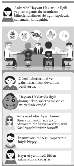
Şekil 6. İdeolojik Olmayan Trollere Örnek