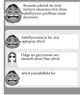
Şekil 7. Dini Trollere Örnek

Dini Trolller: Dini organizasyonların çevrim içi temsilcilerini ve yine çevrim içi topluluklarda dini esaslı ideolojik aktörleri trollemek giderek yaygınlaşmaktadır. Bu troller dini öğretilerdeki çelişkileri hafife alma ve onlardan yararlanma eğilimindedir (Bkz. Şekil 7).