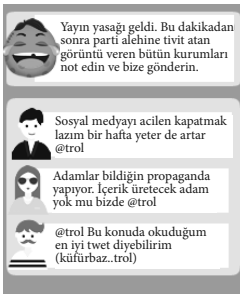
Şekil 4. İdeolojik Trollere Örnek

İdeolojik Troller: İdeolojik bir amaca ulaşmak için çabalayan bu troller sıklıkla siyasi amaçlı bilgisayar korsanlarıyla ve protestocularla bağlantılıdır (Bkz. Şekil 4).